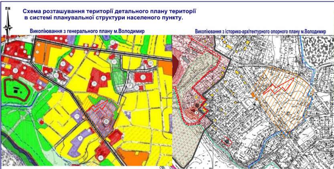
Схема розташування території детального плану території в системі планувальної структури населеного пункту.

Викопіювання з генерального плану м.Володимир