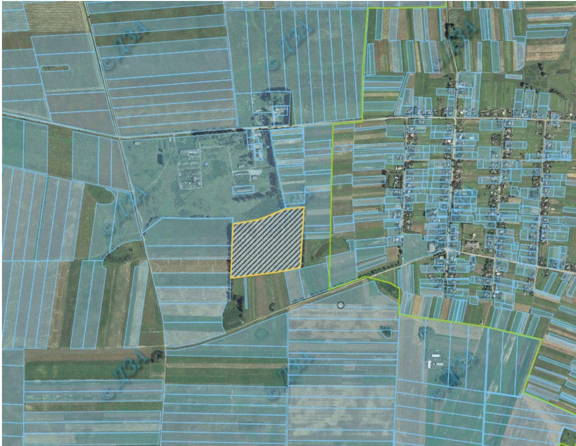
Схема розташування зарезервованої земельної ділянки (як інвестиційно-приваблива) площею 8,9001 га кадастровий номер 0720582800:00:001:0726 за межами населеного пункту с. Ласків