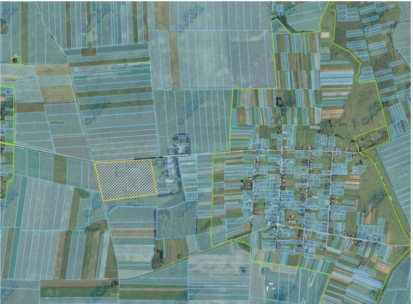
Схема розташування зарезервованої земельної ділянки (як інвестиційно-приваблива) площею 14.00 га за межами населеного пункту с. Ласків