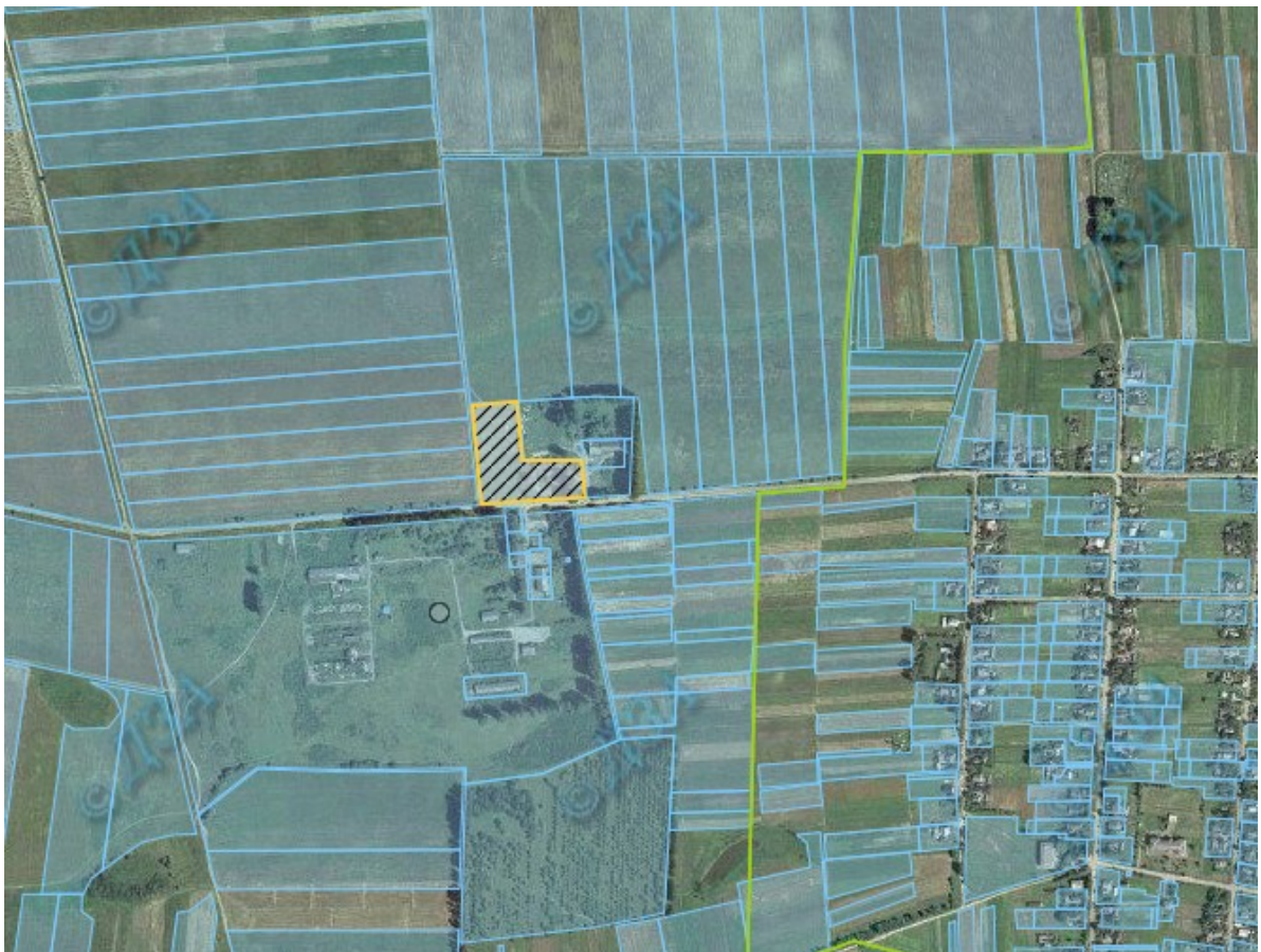
Схема розташування зарезервованої земельної ділянки (як інвестиційно-приваблива) площею 1,8149 га кадастровий номер 0720582800:00:001:0056 за межами населеного пункту с.Ласків