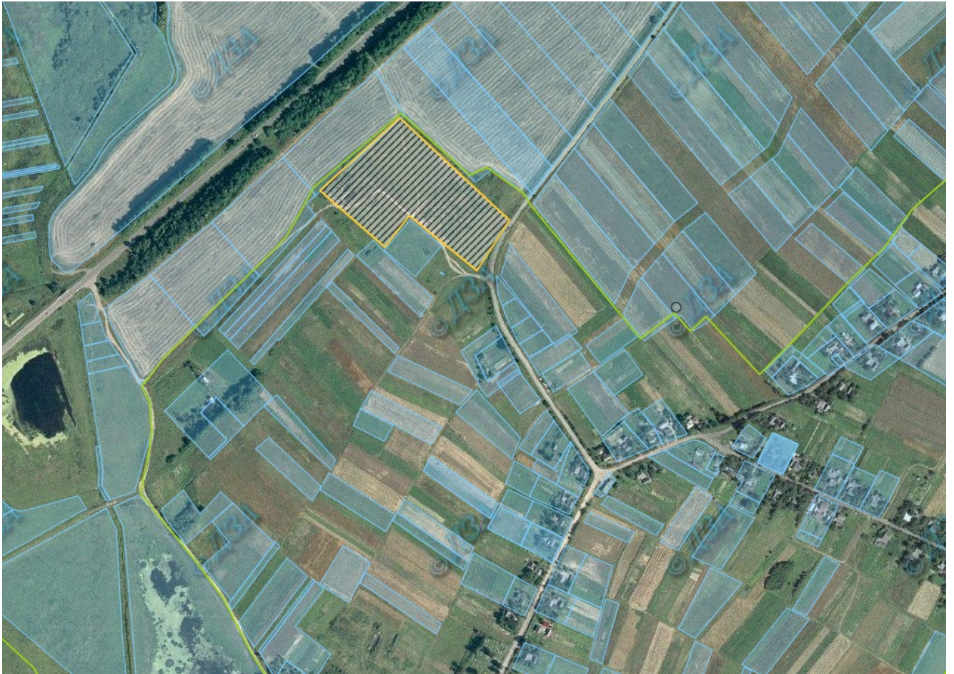
Схема розташування зарезервованої земельної ділянки (як інвестиційно-приваблива) площею 3,30 га в межах населеного пункту с. Дігтів