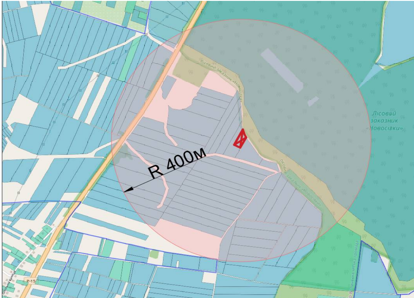
Схема меж опрацювання детального плану території, за межами населених пунктів Володимир-Волинської міської територіальної громади, земельної ділянки з кадастровим номером 0720581600:00:001:0424