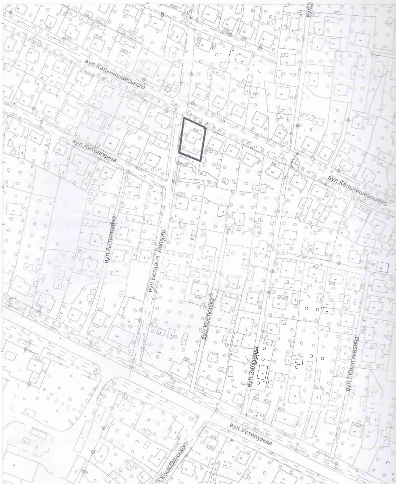
Схема розташування земельної ділянки м.Володимир-Волинський, вул.Кальнишевського, 25